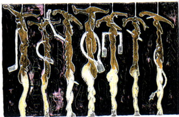
760. Bjørn Nørgaard