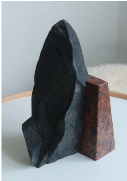
Lis Andersen (ny skulptur)