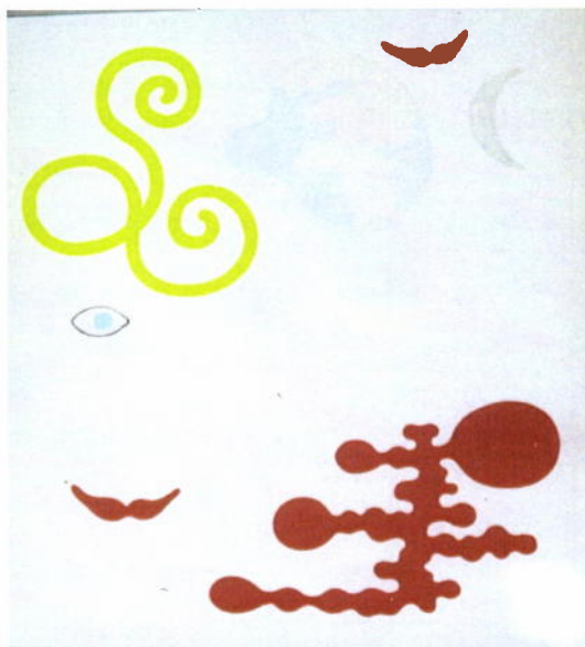
803. Poul Agger