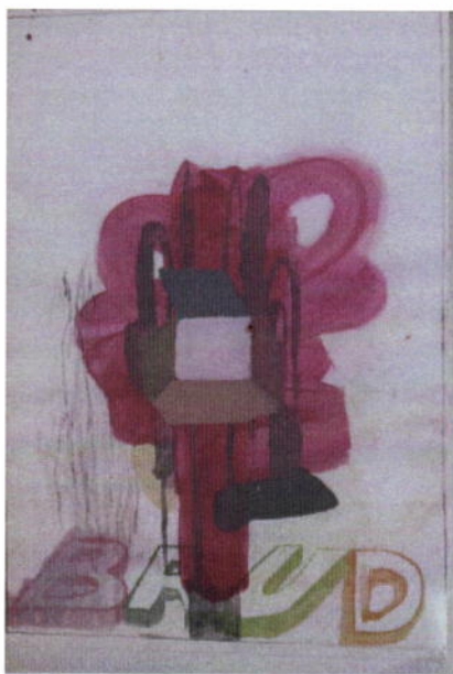
799. Poul Jupont