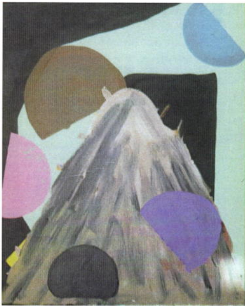
806. Mikkel Engelbredt