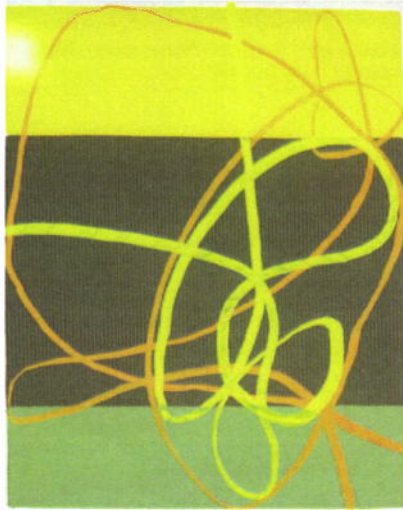
807. Malene Landgren