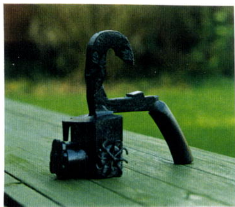
750. Egon Fischer