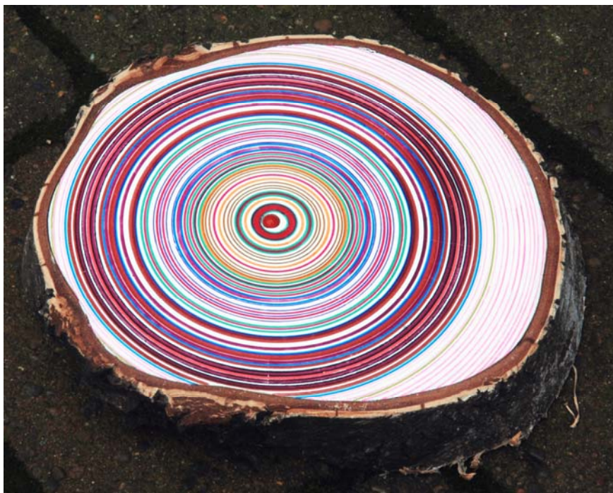
Eva Larsson: Akryl på Birketræ